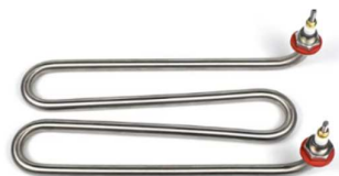
M shape Heater : SUS304