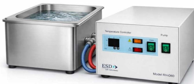
Example usage illustration.