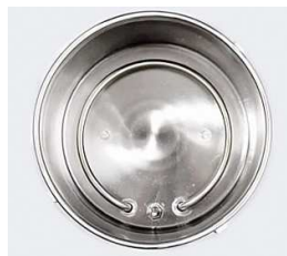
Heater : SUS304