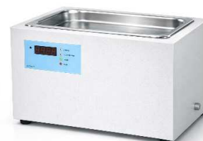
Model : WA-D10