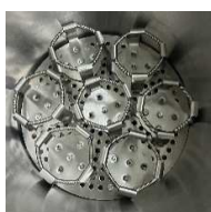
Ex. Rack for Bottom