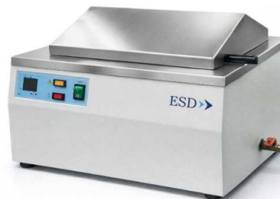
Model : WD-D16