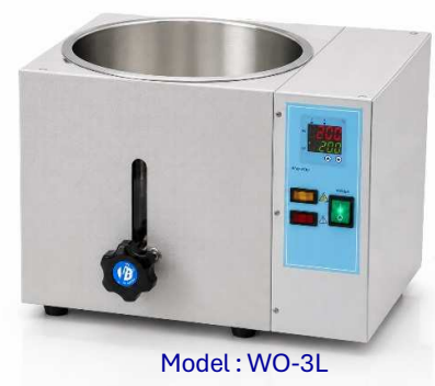
Model : WO-3L